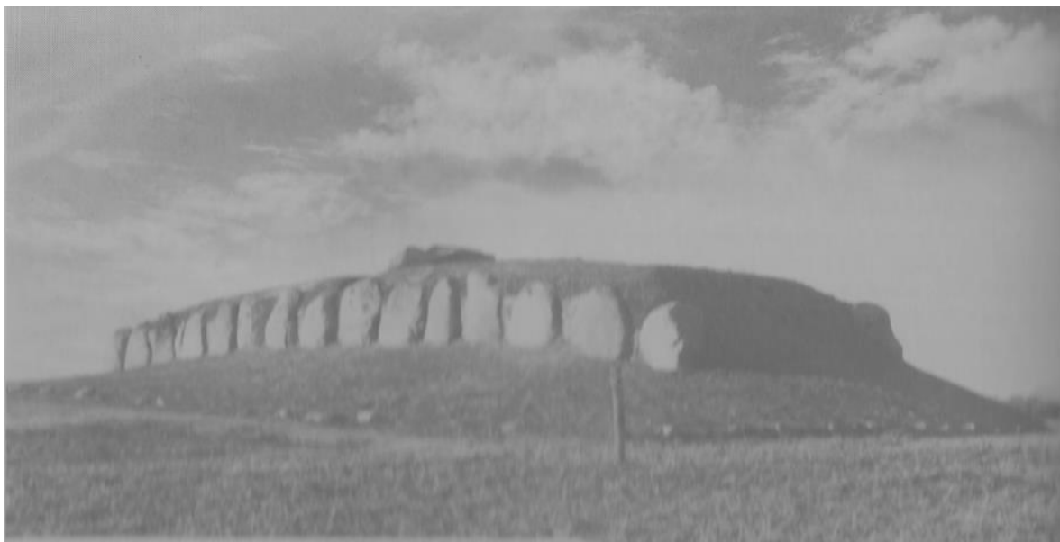
Restaureret langdysse på Lange-land med randsten, som der også har været omkring Fladhøj.

Fladhøj har altså oprindeligt været ganske anseelig – nok 50-60 meter lang. Afgravningen mod øst – ind mod Autrup - er givetvis sket ved anlæggelsen af den nuværende Fladhøjvej. Vejen er anlagt en gang i sidste halvdel af 1800 tallet.