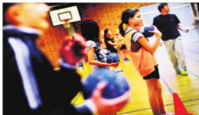
IF92 Håndbold er en af de klubber, der frygter for livet med udsigt til nye nedskæringer. Så sent som i sidste uge holdt klubben krisemøde, dels pga. manglende hænder og dels pga. et stort underskud.

Hos IF92 Håndbold har klubben stadig et underskud på 25.000 kr. som resultat af kommunens sidste