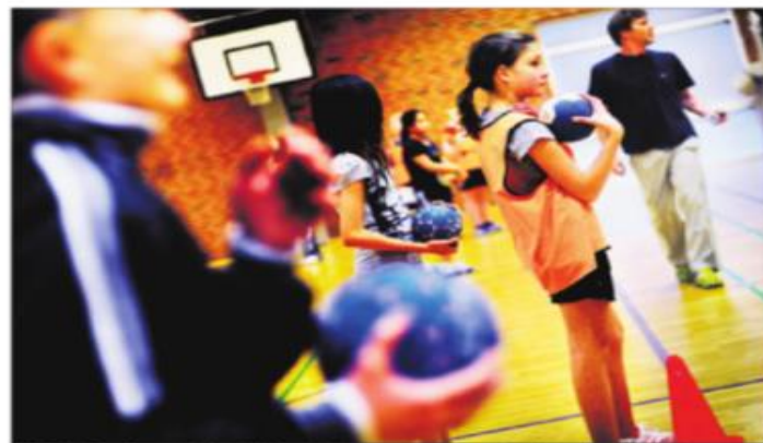
IF92 Håndbold er en af de klubber, der frygter for livet med udsigt til nye nedskæringer. Så sent som i sidste uge holdt klubben krisemøde, dels pga. manglende hænder og dels pga. et stort underskud.

Hos IF92 Håndbold har klubben stadig et underskud på 25.000 kr. som resultat af kommunens sidste