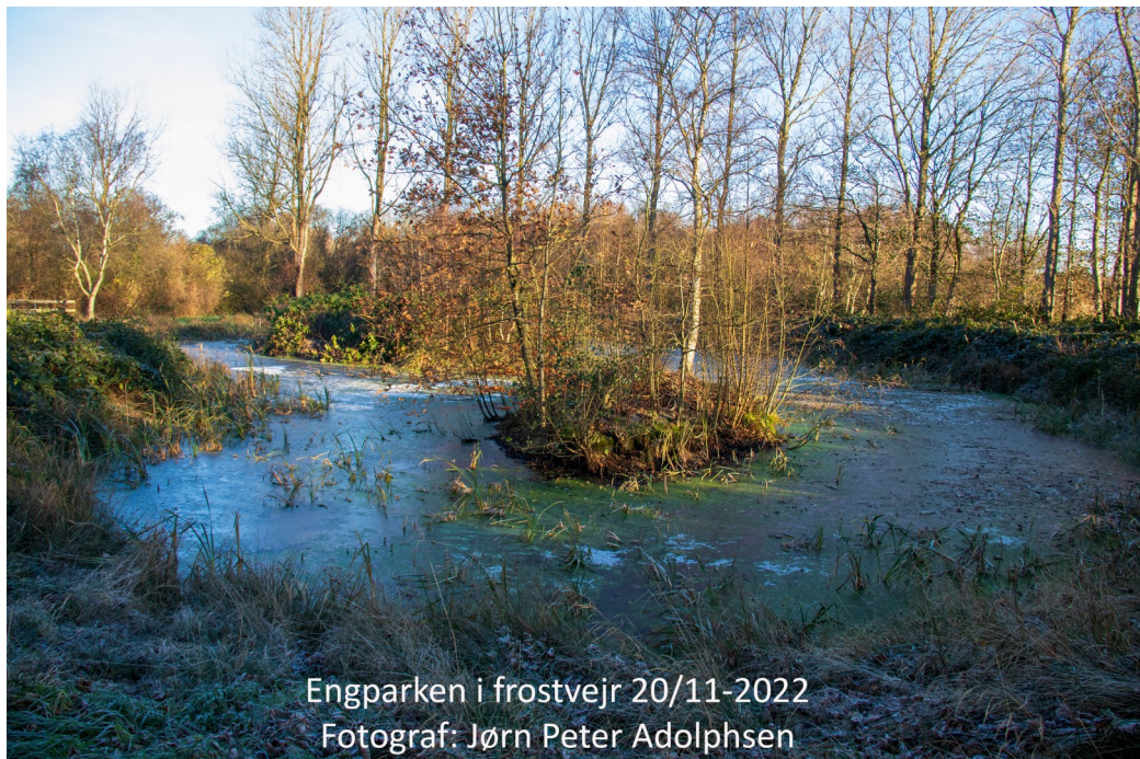
Engparken i frostvej 20/11-2022