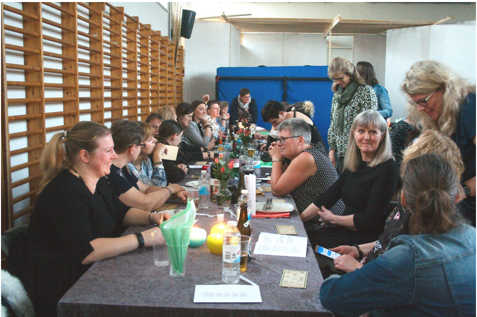
Fra damefest i Kvong