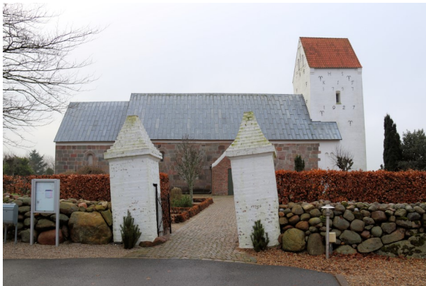
Kvong Kirke– december 18